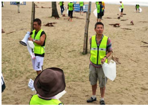
開会と理事長の挨拶