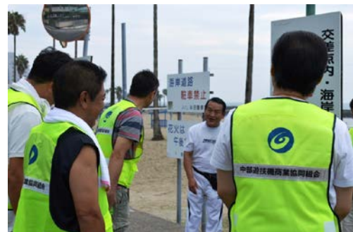
愛遊協の兼松専務も参加されました