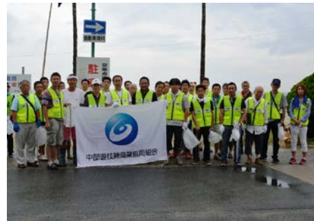
今回の参加メンバー

今回は運悪く悪天候の中行われました。一見きれいに見える海岸でも、よく見ると意外に大小のゴミが散乱していましたので、思っていた以上にたくさん集まりました。