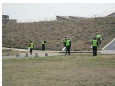
すみずみまできれいに。