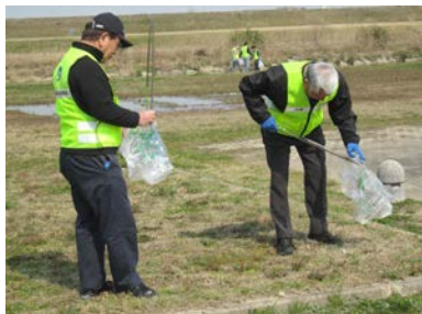
細かなゴミもしっかりと拾いました。