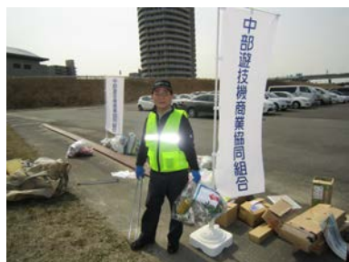
前島副理事長も参加されました。