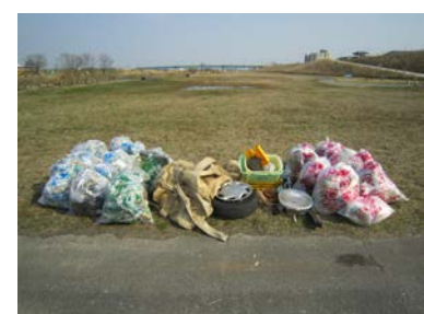
2時間弱でこれだけ集まりました。