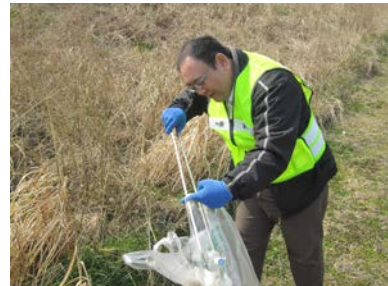
缶、ペットボトルがたくさんありました。