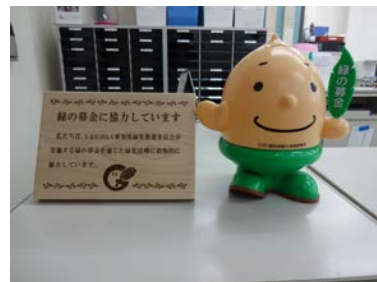
事務局カウンターに募金箱を設置しております。