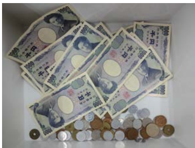
今回、寄付された金額、20,658 円。