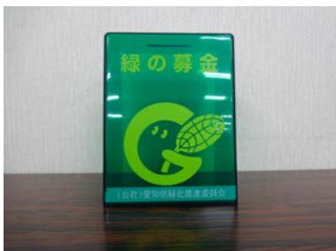
見かけたらぜひご協力を・・・。