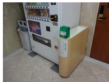
1F エントランス、自販機横にも募金箱を設置しております。