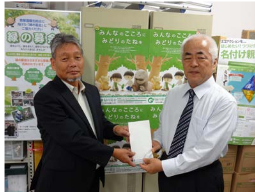
浅村リサイクル・環境対策委員長と緑化推進委員会稲生事務局長

「緑の募金」を公益社団法人愛知県緑化推進委員会へ贈呈をいたしました。今回の金額は平成 26 年度上期に集められた¥20,658 となりました。皆様のご協力に感謝いたします。これからも引き続きご協力をお願いいたします。