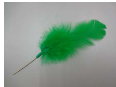
緑の羽根のご理解ありがとうございます。