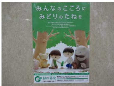
みんなのところにみどりのたねを…。