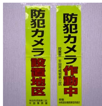
防犯カメラ設置柱及び区内に提出された ステッカー