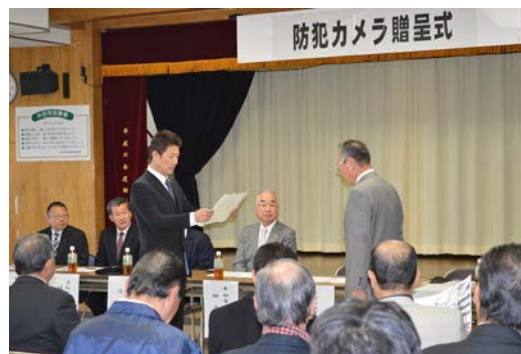
林理事長から杉江区長に目録を贈呈