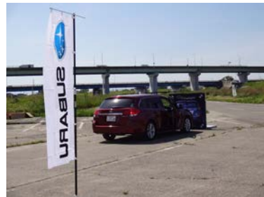
ぶつからないスバルの EyeSight を体感。