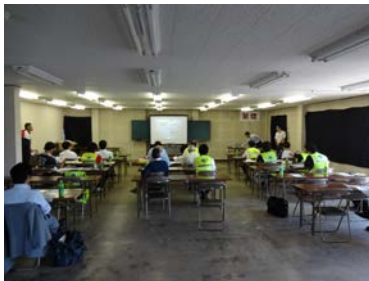
日本自動車連盟より講義を受け…。