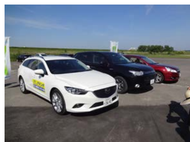
左より、マツダ・アテンザ、三菱アウトランダー、スバル・レガシイ