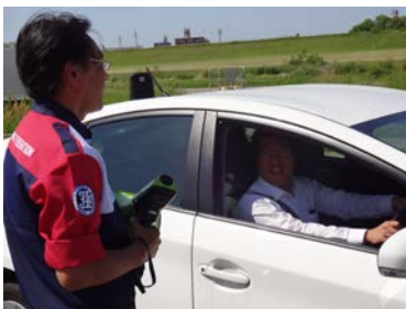
注意点等の指導をして頂きました。