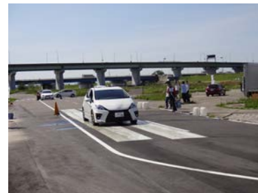
滑りやすい路面での制動力の講習。