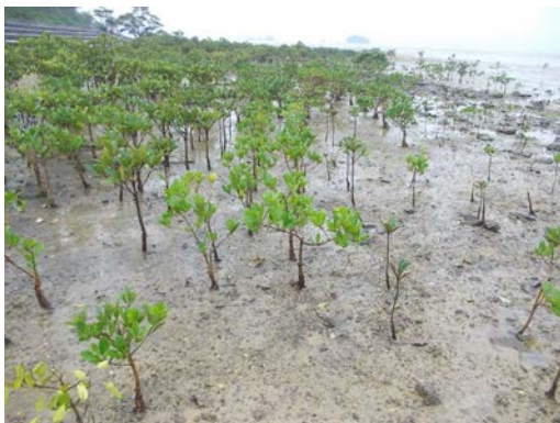
平成 23 年 2 月、11 月に植樹した苗です。