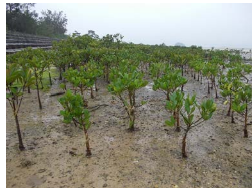
平成 22 年 3 月に植樹した苗です。