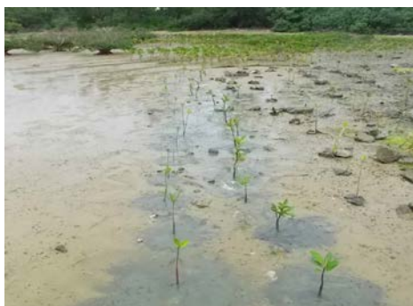
20 株植えていただきました。