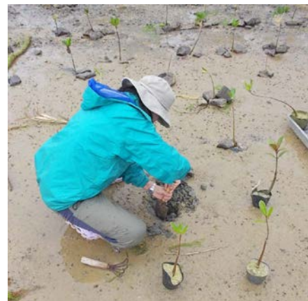
今年の苗も丈夫に育つように願いを込めて、