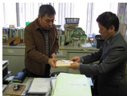
募金参画の協力プレートを頂きました