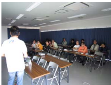
まずは、座学の講習から・・・