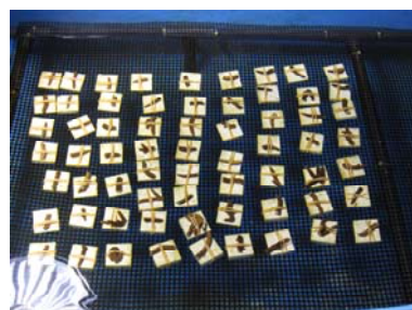
みんなで植付ました。