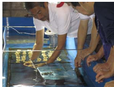
しっかりと、レクチャーを受け。