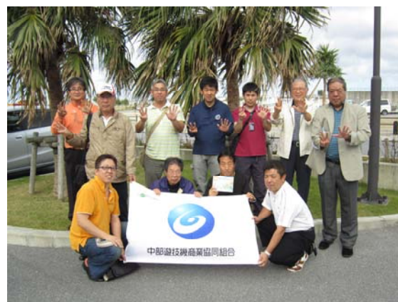
今回、参加した委員での記念撮影

今は、小さな珊瑚ですが、これから先、何十年もかけ大きく、立派に育つようにと、現地の NPO 法人・コーラル沖縄の協力の下、委員の手により珊瑚を植付をしました。