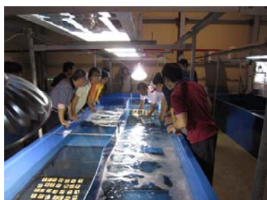
立派に育ちますように・・・